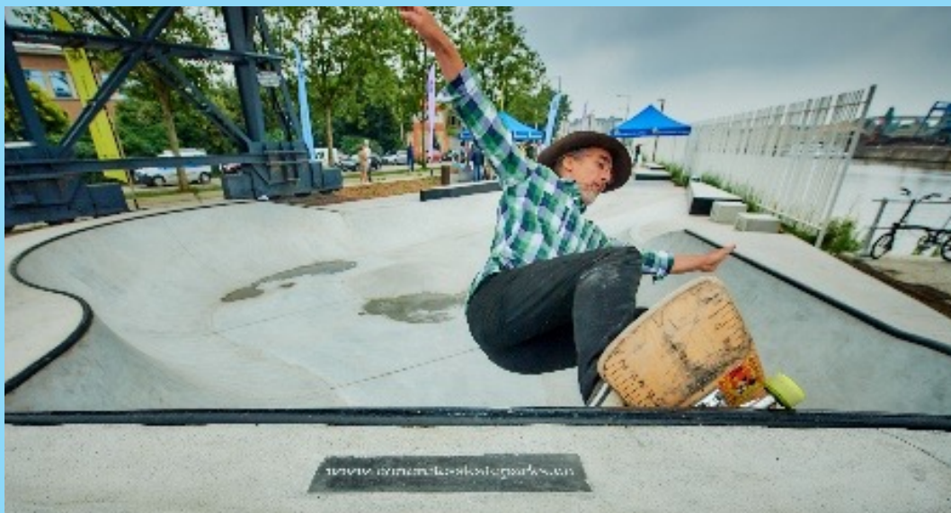
@Port de Bruxelles